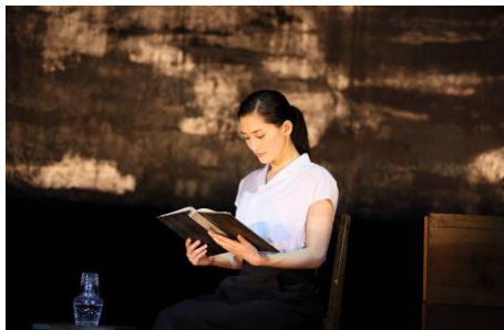
2015年 リメイク版放送